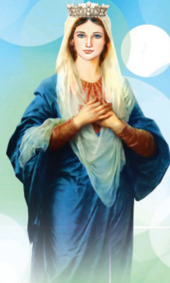
പരി. കന്യകാമറിയത്തിന്റെ ജനനത്തിരുന്നാളാശംസകൾ