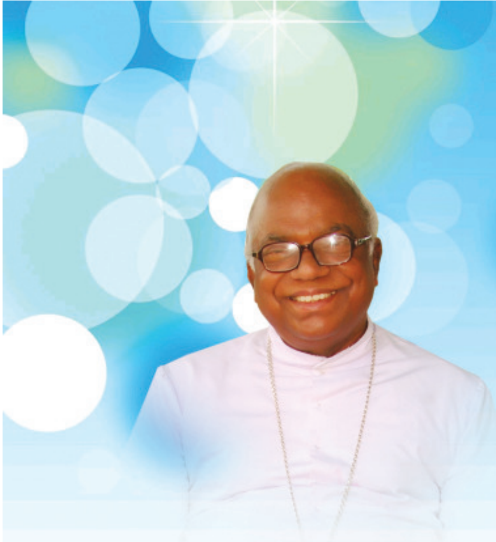
സെപ്തംബർ 21 ന് നാമഹേതുകത്തിരുന്നാളും 23 ന് ജന്മദിനവും ആഘോഷിക്കുന്ന അഭിവന്ദ്യ പിതാവിന് രൂപതാക്കൂടുംബത്തിന്റെ ആശംസകൾ