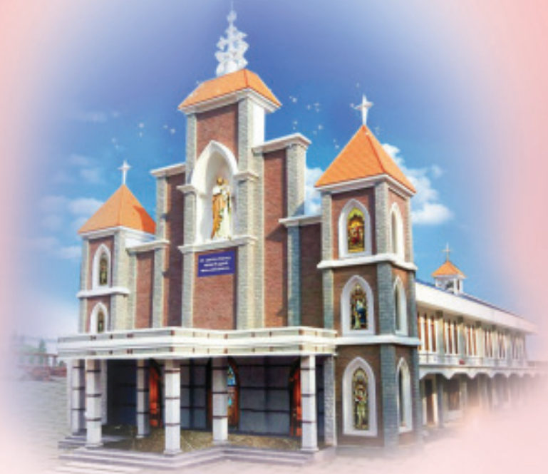
Newly Consecrated Church Kallarkutty