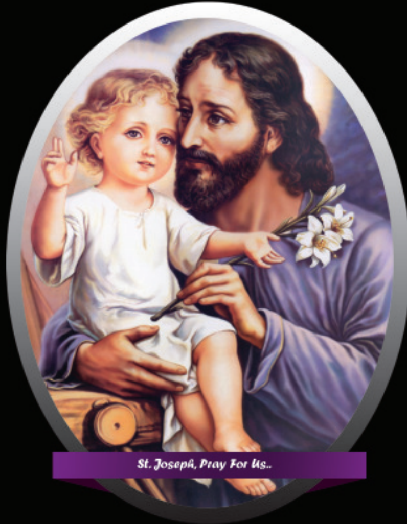
St. Joseph, Pray For Us..