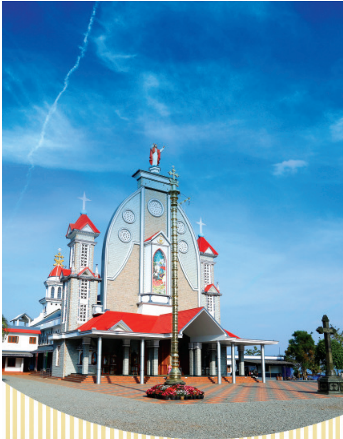
NEWLY CONSECRATED ST. GEORGE CHURCH CALVARYMOUNT